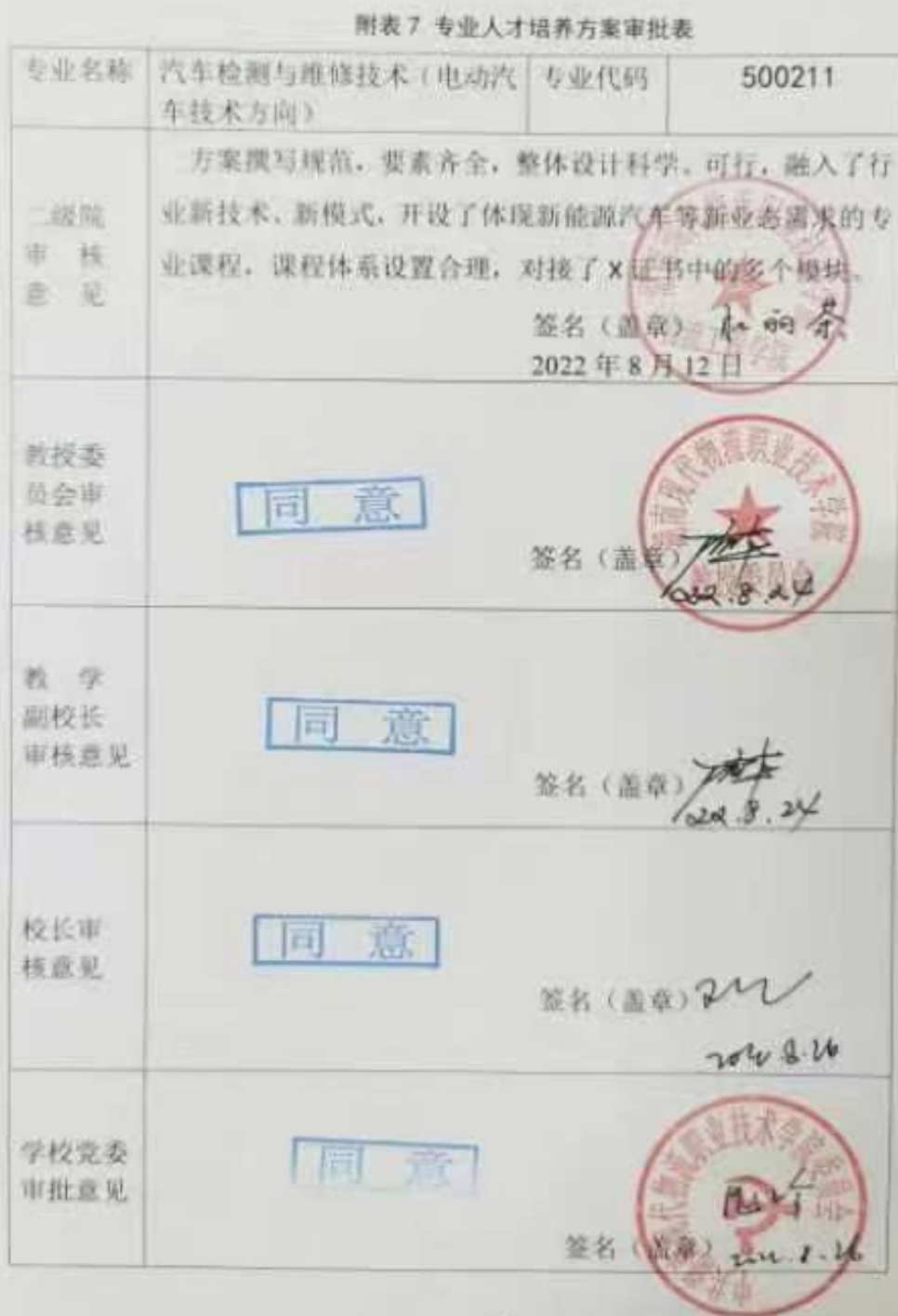
附表7 专业人才培养方案审批表