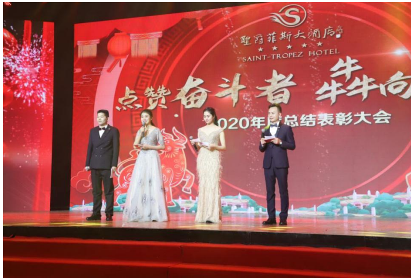
图9 2020年圣爵菲斯大酒店年度总结表彰