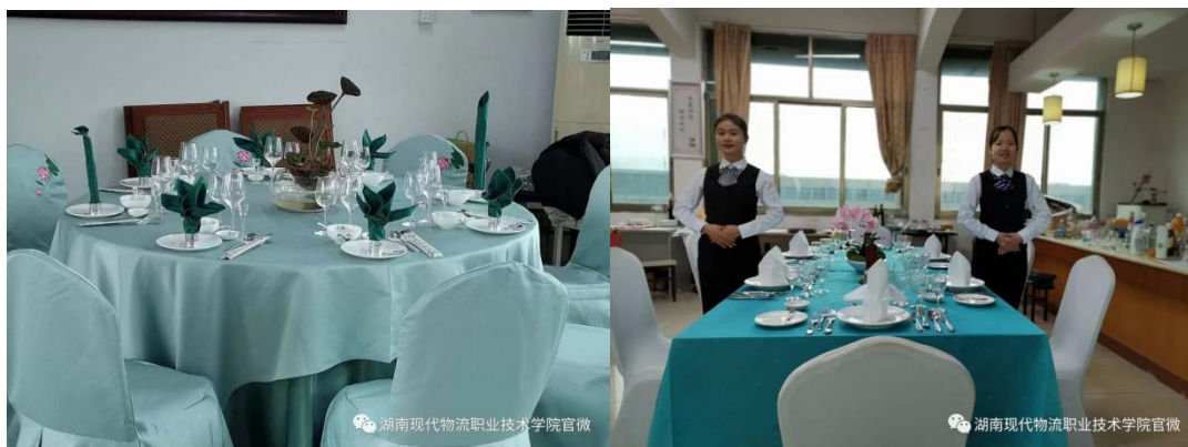
图 13 省赛获奖台面设计作品