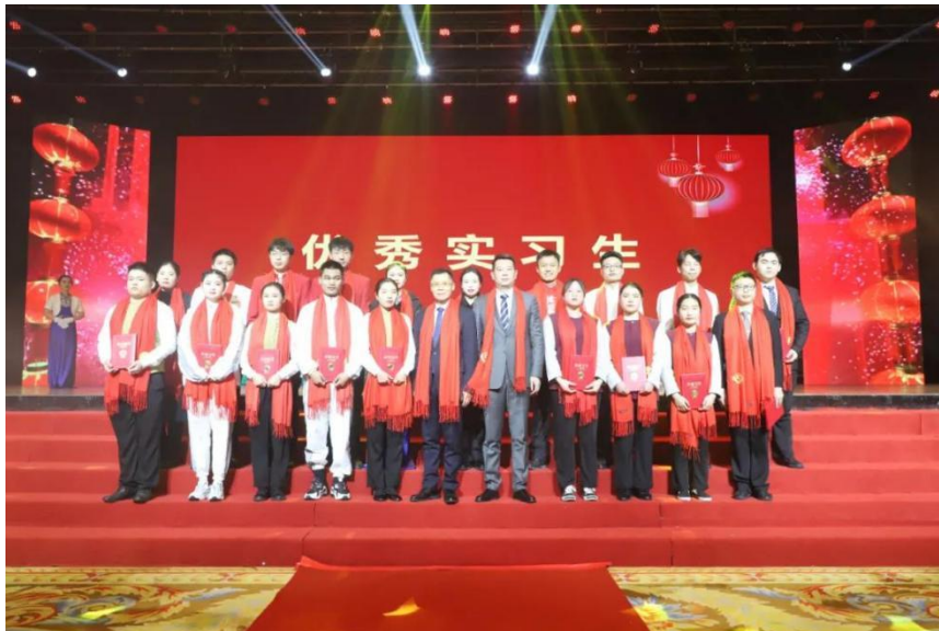
图10 2021年16名优秀实习生受酒店表彰