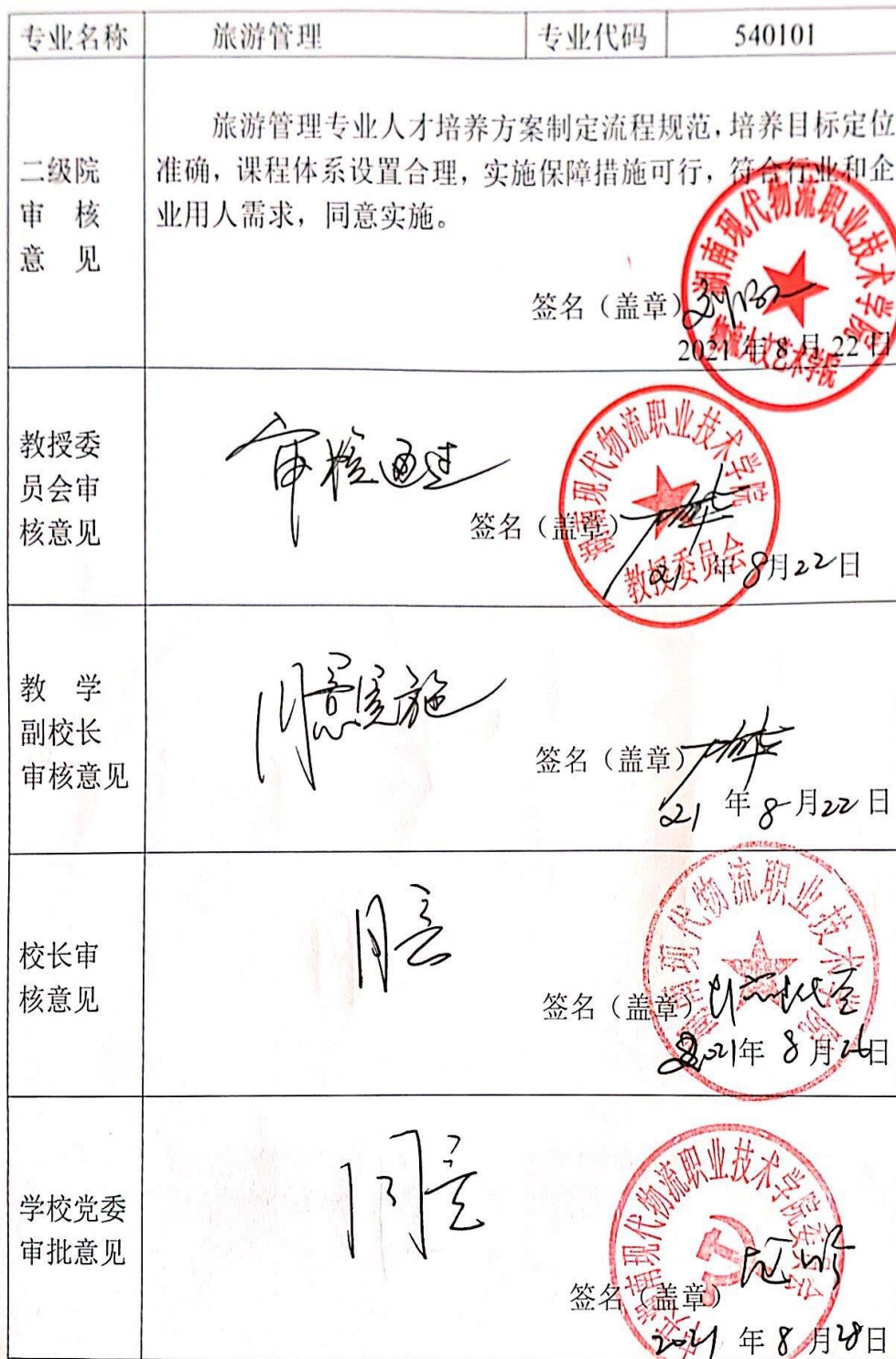
附表7 专业人才培养方案审批表