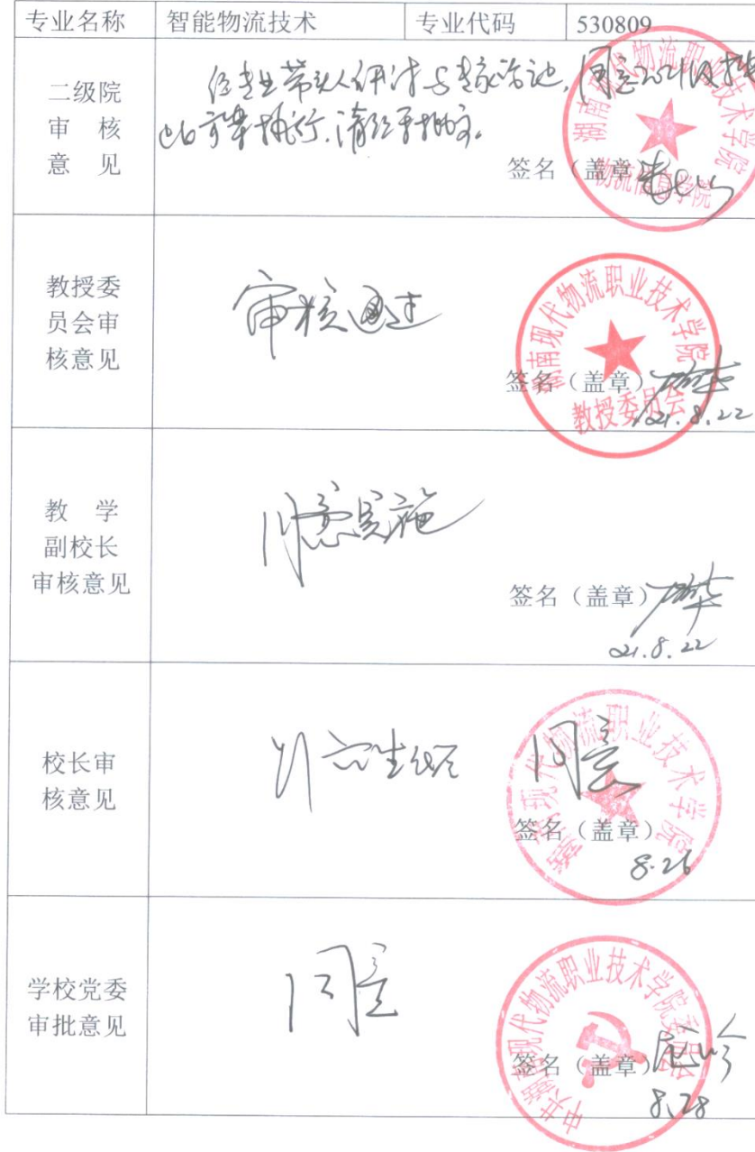
附表7 专业人才培养方案审批表