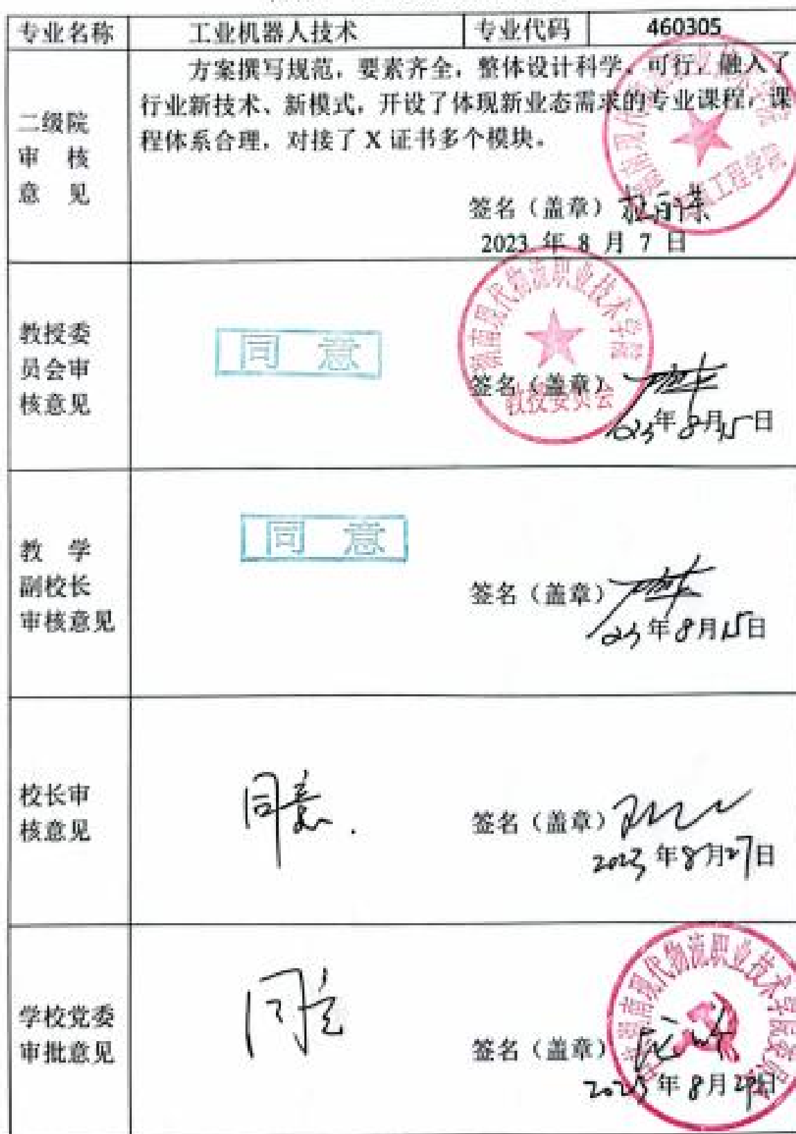
附表7 专业人才培养方案审批表