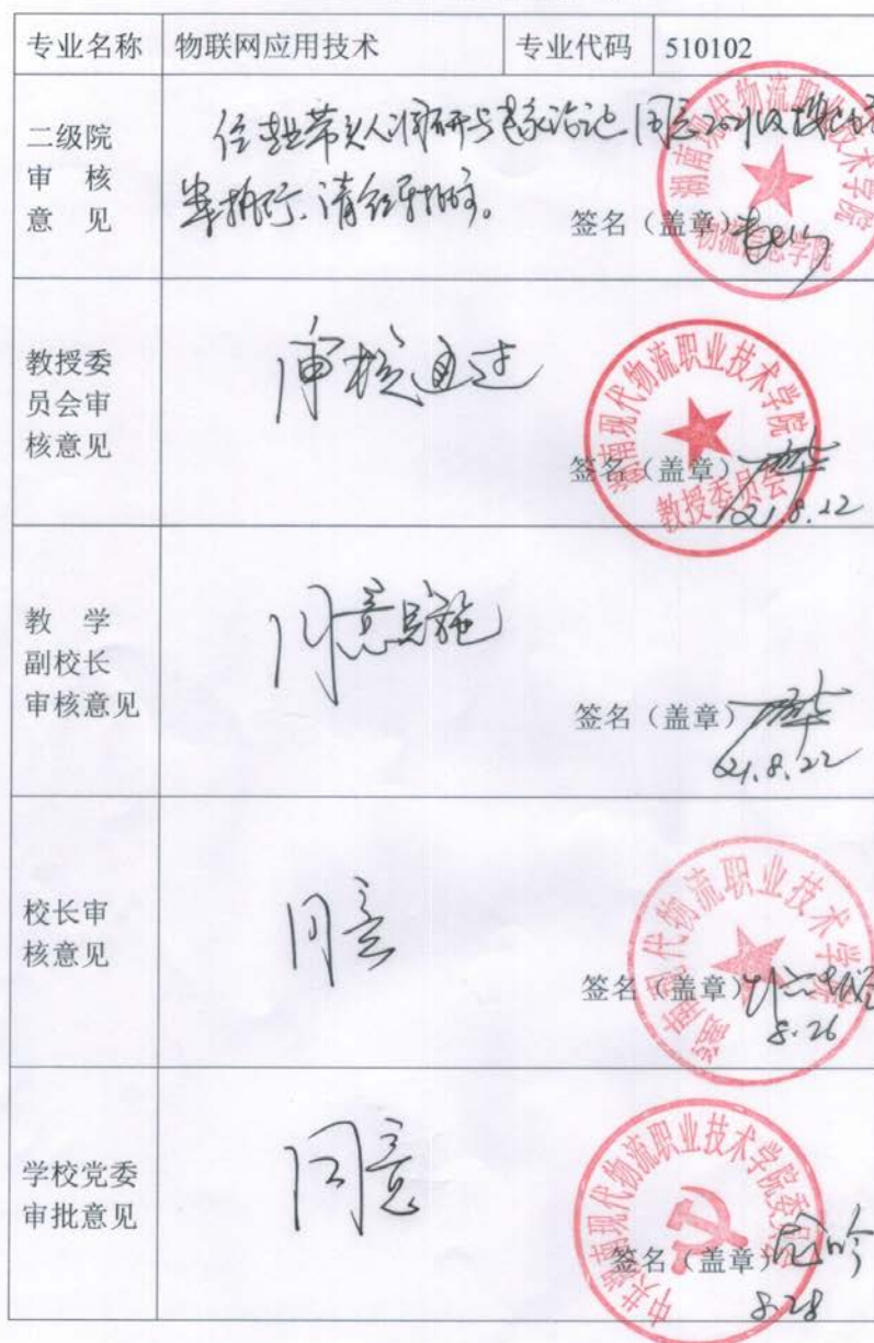
附表7 专业人才培养方案审批表