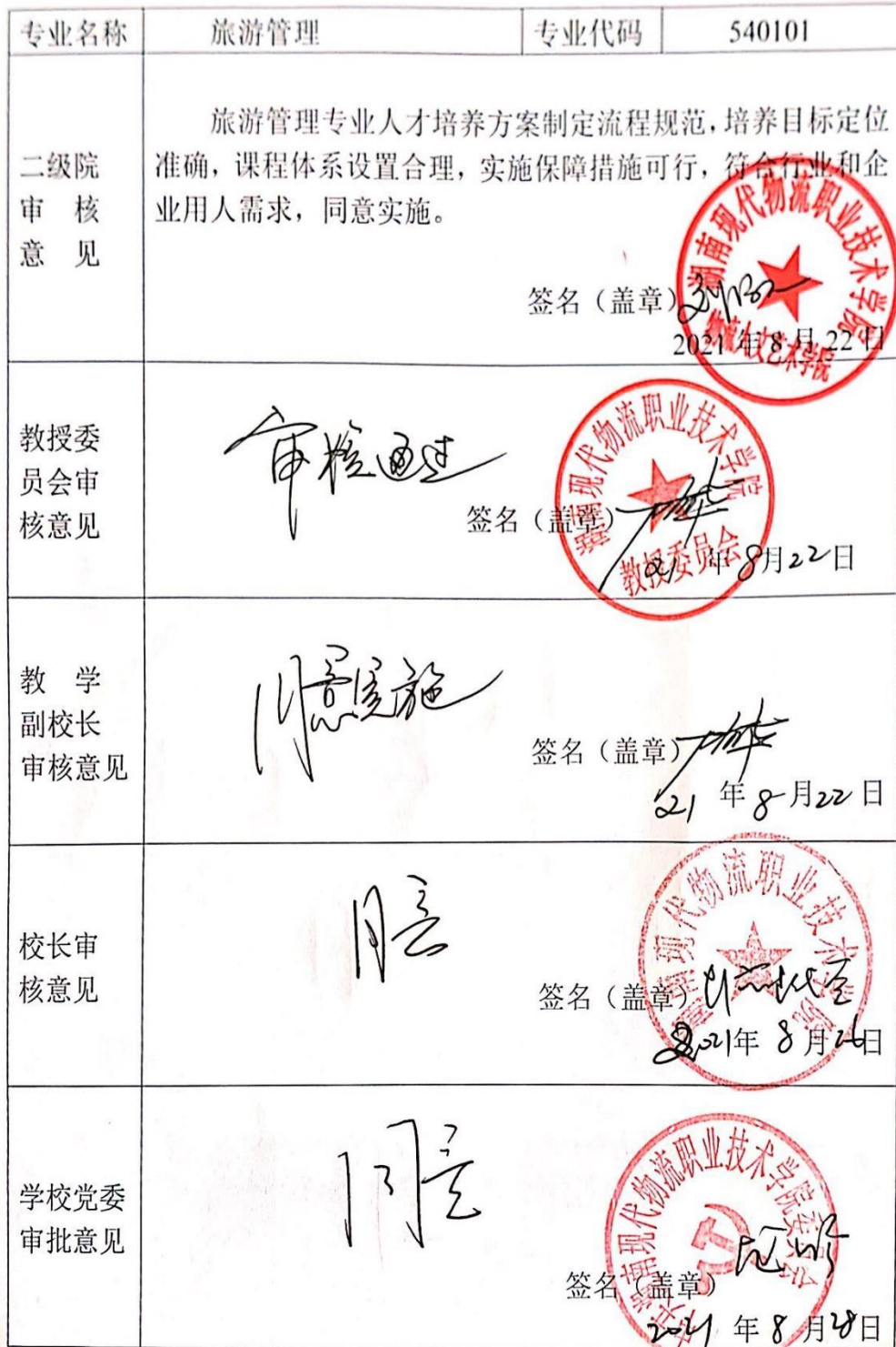
附表7 专业人才培养方案审批表