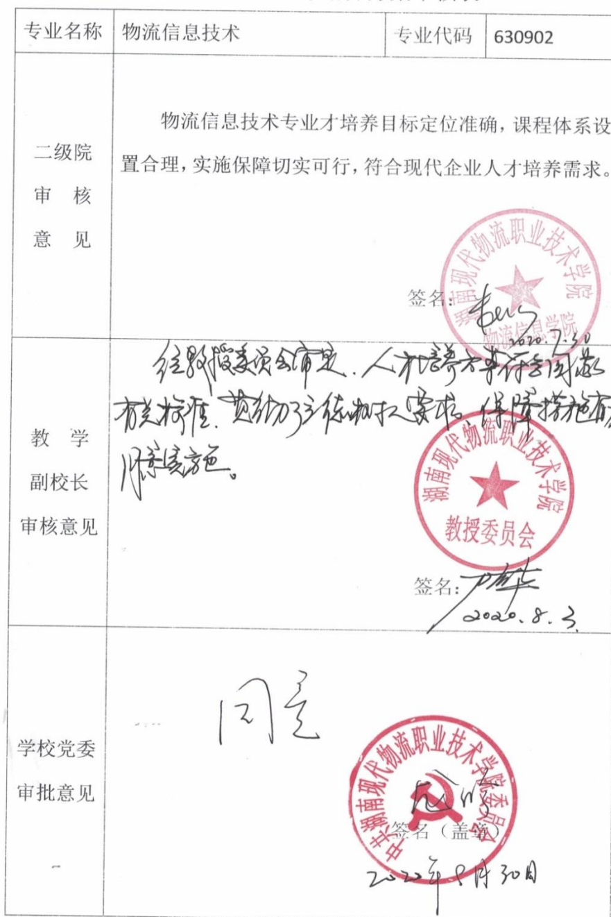
2020 级专业人才培养方案审核表