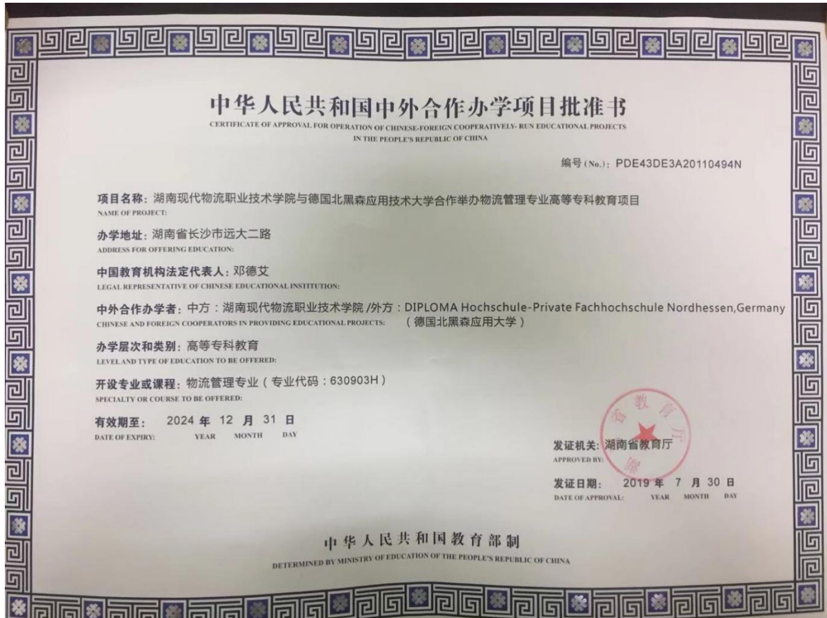
图1 现代物流管理专业（中外合作办学）项目批准书